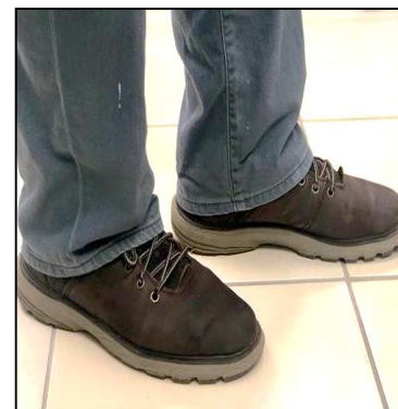
Figura 3. El calzado para viajar debe estar completamente limpio y que no se haya usado en plantaciones agrícolas.

Es absolutamente necesario cumplir con las recomendaciones anteriores al pie de la letra. La sostenibilidad de la actividad agrícola, especialmente de bananos y plátanos en América Latina, depende en gran medida de evitar la entrada de plagas exóticas de alto impacto económico como Foc R4T.