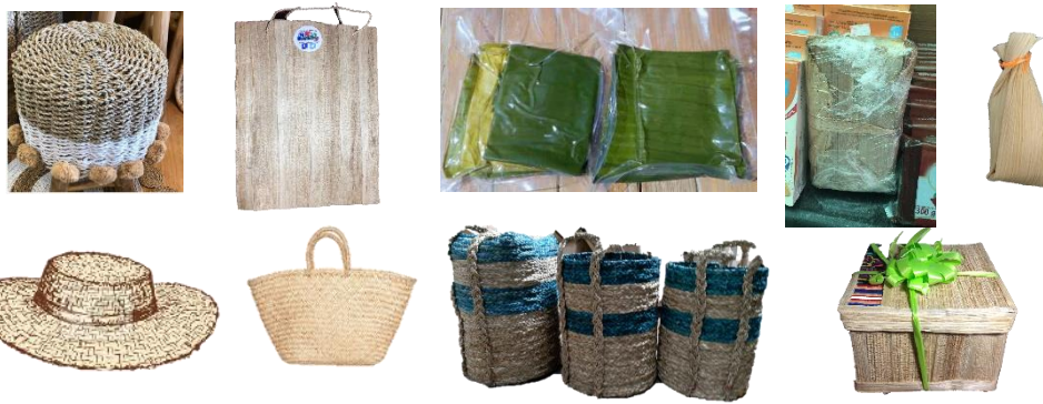
Figura 2. Ejemplos de artículos, artesanías y empaques fabricados con fibras o tejidos de banano cuyo ingreso a Costa Rica está prohibido en caso de que se hayan adquirido en un país con presencia de Foc R4T. En este tipo de tejido pueden sobrevivir las esporas del hongo con las cuales podría iniciar una epidemia de la enfermedad en cualquier lugar.